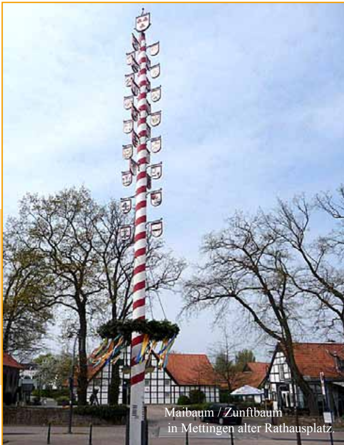
Maibaum / Zunftbaum in Mettingen alter Rathausplatz.