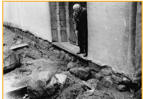
Die Aufnahme zeigt die freigelegten Findlinge unter der Wersener Kirche im Oktober 1979. Damit sah Heinrich Inderwisch (im Hintergrund) seine schon vor über 50 Jahren aufgestellte Behauptung bestätigt.

Die beiden größeren Glocken konnten allerdings nicht gehalten werden. Die kleinere - 1770 gegossen und im Volksmund „de Pingel“ genannt - kam aber nach dem Krieg nach Wersen zurück. Die Hauptglocke blieb allerdings verschollen; sie wurde 1955 durch eine neue Glocke ersetzt.