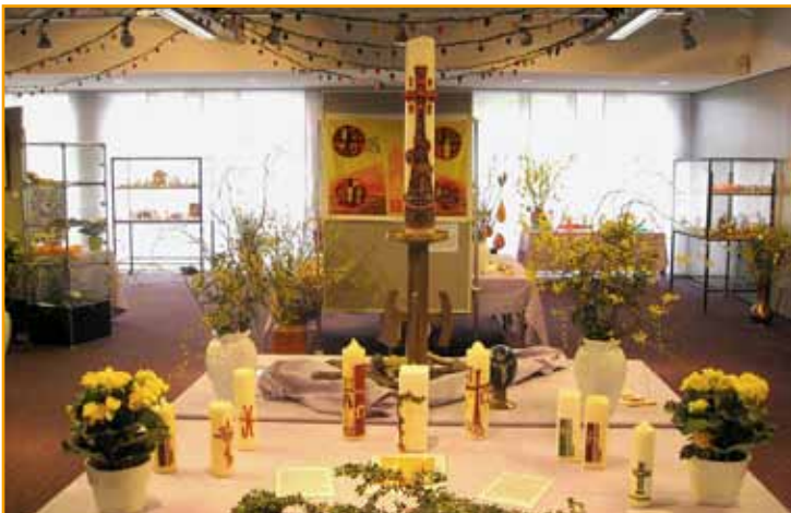
Die Osterkerze aus der Pfarrkirche St. Gertrudis - Horstmar von 1992 als Blickfang einer Ausstellung