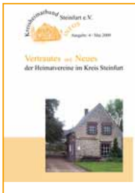
Ausgabe 4 - 5/2009