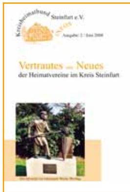
Ausgabe 2 - 06/2008