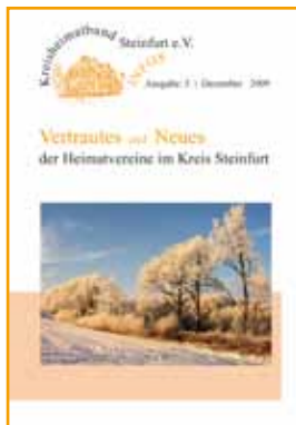
Ausgabe 5 - 12/2009