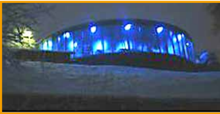
Eisscholle am Abend

Terminvereinbarungen beim Bürgeramt der Gemeinde Altenberge 02505/82-32 und 82-33.