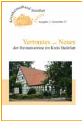
Ausgabe 1 - 12/2007