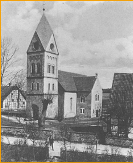
Das Foto stellte Renate Schwentker zur Verfügung. Die Aufnahme - eine Photographie von K. u. P. Herring (Paul Friedrich Herring war Pfarrer in Wersen von 1933 bis 1952) - zeigt das ursprünglich unverputzte Bruchsteinmauerwerk des Kirchturms vor 1958. Rechts im Bild ist noch das Küsterhaus zu sehen, das im Jahre 1959 wegen Baufälligkeit abgerissen wurde.

den, dass sie schon etwas früher -eventuell um 1120 - errichtet wurde. Zu der Zeit hatten die Grafen von Tecklenburg in Wersen nämlich Landbesitz geerbt. Mit dem Neubau des 30 Meter hohen Kirchturms im Jahre 1886 erhielt die Wersener Dorfkirche ihr heutiges Aussehen. Der bauliche Zustand des bis in das Jahr 1400 zurückdatierten Vorgängers – wegen seiner Eindeckung mit Dachpfannen „Pannentoren“ genannt – verschlechterte sich gegen Ende des 19. Jahrhunderts erheblich. Die drei in dem Turm hängenden Glocken hatten die Standfestigkeit des Bauwerks offensichtlich extrem stark beansprucht, so dass der Turm schließlich wegen Bau-fälligkeit abgerissen werden musste. In der Festschrift „100 Jahre Kirchturm Wersen“ findet sich dazu ein Auszug aus dem Protokollbuch des Presbyteriums der evangelischen Kirchengemeinde Wersen vom Februar 1884: