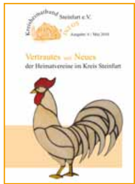
Ausgabe 6 - 05/2010