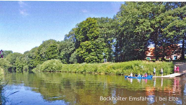
Bockholter Emsfähre | bei Elte